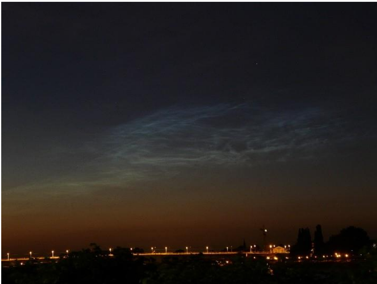
Abb. 1: Leuchtende Nachtwolke über Bonn, 23.06.2009, 23:30 MESZ; Belichtungszeit 8s bei ISO 100; Brennweite 15mm digital, Blende 3.6. Sonne 11 Grad unter dem Horizont.

Im diese Beitrag erfahren Sie zum Start der NLC-Saison 2010, wie Leuchtende Nachtwolken nach heutiger Kenntnis entstehen und wann, wo und wie man sie beobachten kann.