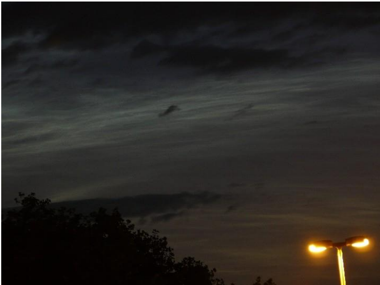
Abb. 4: Auffallend helle NLC am Morgen des 15.07.2009, 04:25 MESZ; Belichtungszeit 2s bei ISO 100; Brennweite 45mm digital, Blende 3.6. Sonne 9 Grad unter dem Horizont.

Unabhängig von der geografischen Breite des Beobachtungsstandortes sind Leuchtende Nachtwolken vom Ende der bürgerlichen Abenddämmerung bis zum Beginn der bürgerlichen Morgendämmerung (Sonne jeweils 6^\circ unter dem Horizont) beobachtbar. Davor und danach ist es wie erwähnt zu hell. Unterbrochen wird das nächtliche Sichtbarkeitsfenster, sobald die Sonne 16 Grad unter dem Horizont steht. Dann nämlich befinden sich selbst NLC, die für den Beobachter am Horizont stehen, im Erdschatten [2, 5, 6]. Die Zeitpunkte für die Sonnenstände von -6 bzw. -16 Grad kann man für seinen Beobachtungsort z.B. mit einem Planetariumsprogramm ermitteln.