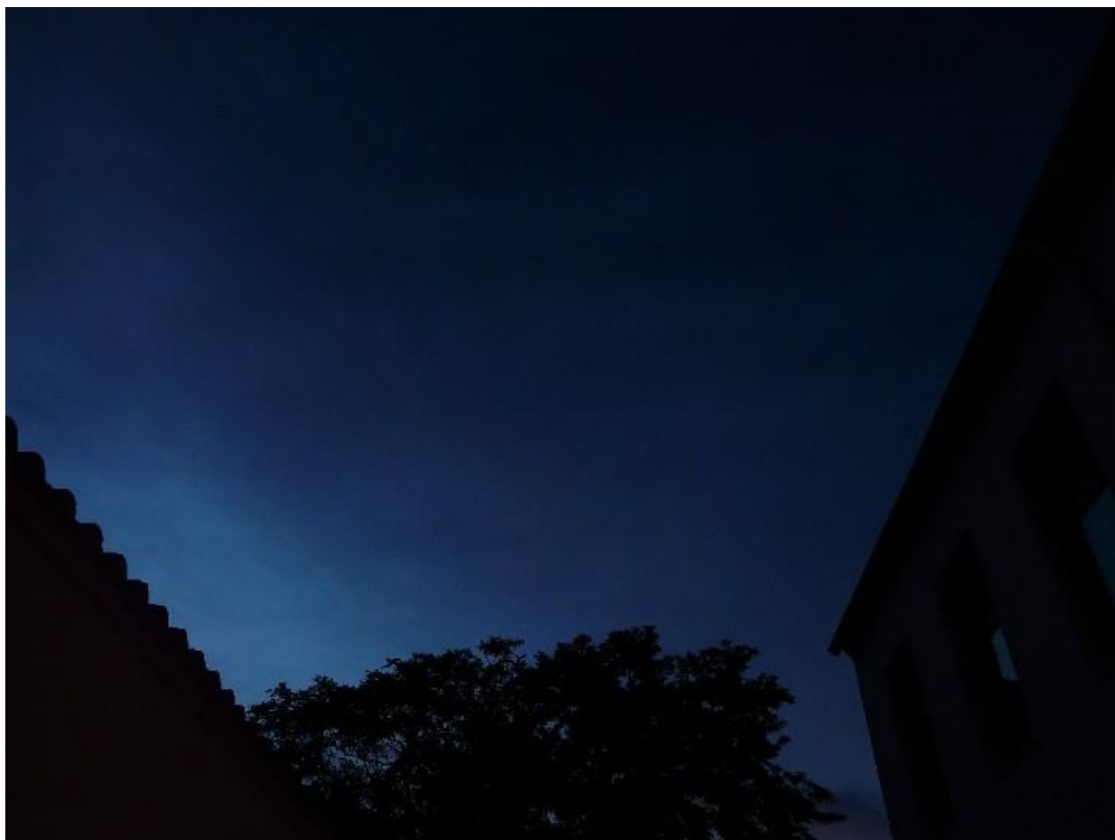
Abb. 5: Ausgedehntes NLC-Display, das bei Beginn der nautischen Dämmerung in Zenitnähe eine hohe Transparenz aufweist. 14.07.2009, 22:37 MESZ; Belichtungszeit 0.5s bei ISO 100; Brennweite 5mm digital, Blende 2.8. Sonne 7\frac{1}{2} Grad unter dem Horizont.

Sofern dies zeitlich machbar ist, sollte man seine Beobachtung am Abend beginnen, sobald die Sonne etwa 6 Grad unter dem Horizont steht. NLC werden zuerst in Zenitnähe sichtbar als hauchdünne bläuliche Gebilde, die gar nicht so einfach von Zirren zu unterscheiden sind (Abb. 5). Die optische Dichte der Wolken beträgt nur etwa 10^{-3} bis 10^{-5} . Das Display wird sich vergleichsweise schnell in Richtung Norden verlagern, weil die Mesosphäre über dem Beobachtungsort in den Erdschatten gerät. Sobald die Schattengrenze etwa 30 Grad über dem Nordhorizont (genauer: über dem aktuellen Azimut der Sonne) angelangt ist, bieten die NLC den „klassischen“, von zahlreichen Fotos [23, 24, 25] bekannten Anblick. Dass sie jetzt zunehmend heller erscheinen, hat zwei Gründe: zum einen nimmt die Überblendung durch das atmosphärische Streulicht in der Umgebung des Beobachters immer mehr ab, zum anderen wirkt sich der von normalen Wolken wohlbekannt perspektivische Effekt aus. Wir blicken nicht mehr wie anfangs vertikal auf eine wenige hundert Meter dicke Schicht extrem dünner Wolken, sondern von schräg unten fast auf die Kante eines sich horizontal über dutzende oder hunderte Kilometer erstreckenden Wolkenfeldes.