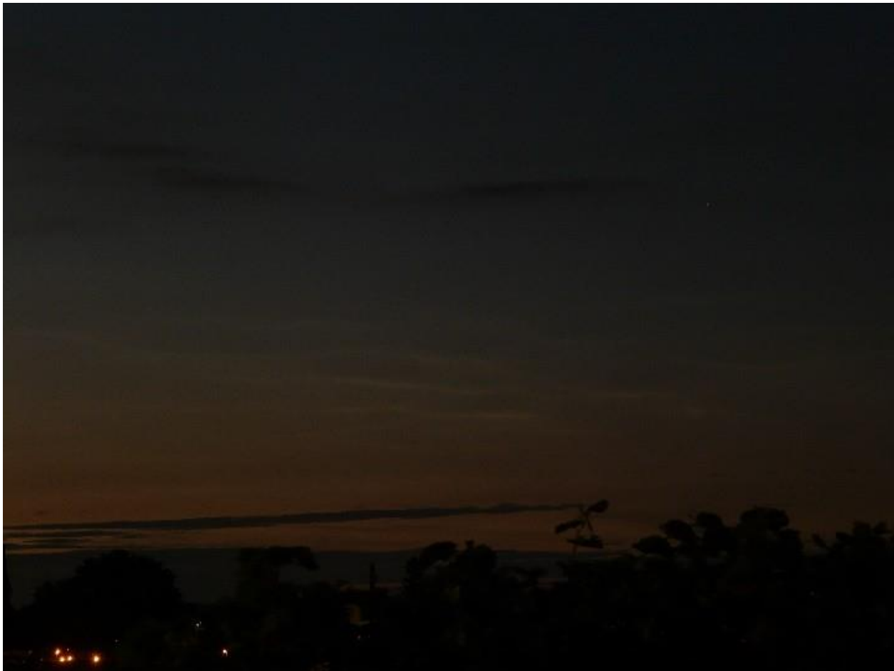
Abb. 7: Leuchtschwache NLC wie diese lassen sich oft kaum von Zirren unterschieden. 25.06.2009, 23:13 MESZ; Belichtungszeit 4s bei ISO 100; Brennweite 24mm digital, Blende 3.6. Sonne 9\frac{1}{2} Grad unter dem Horizont.

Wer Leuchtende Nachtwolken fotografieren möchte, benötigt ein Stativ oder zumindest eine geeignete Ablage (z.B. Fensterbank, Mauerkrone) für die Kamera, da die erforderlichen Belichtungszeiten recht lang sind. Zumindest gilt dies für die üblichen Digitalkameras, welche bei höheren ISO-Zahlen ein starkes Rauschen produzieren. Bei ISO 100 benötigt man aber selbst bei weit geöffneter Blende und im Weitwinkelmodus Belichtungszeiten im Bereich von einer bis mehrere Sekunden, je nach Dämmerungsgrad. Man sollte sich dabei nicht auf die Belichtungsautomatik verlassen, sondern mit manuellen Einstellungen arbeiten. Mit Hilfe der Bildkontrolle am Kameradisplay wird man schnell herausfinden, bei welchen Einstellungen der visuelle Eindruck am besten reproduziert werden kann.