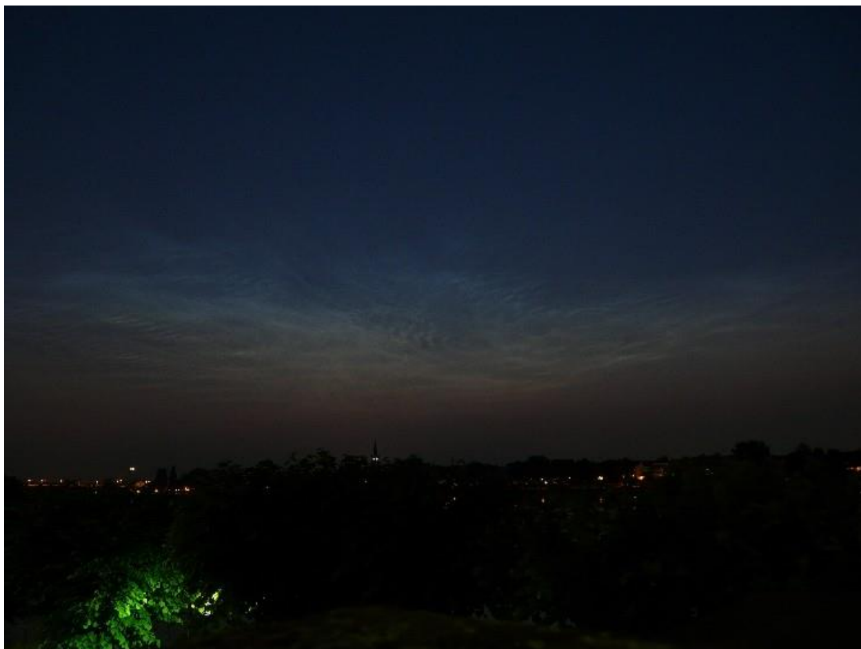
Abb. 3: Eindrucksvolles NLC-Display am Morgen des 02.07.2009, 03:58 MESZ; Belichtungszeit 4s bei ISO 100; Brennweite 5mm digital, Blende 2.8. Sonne 10 Grad unter dem Horizont.