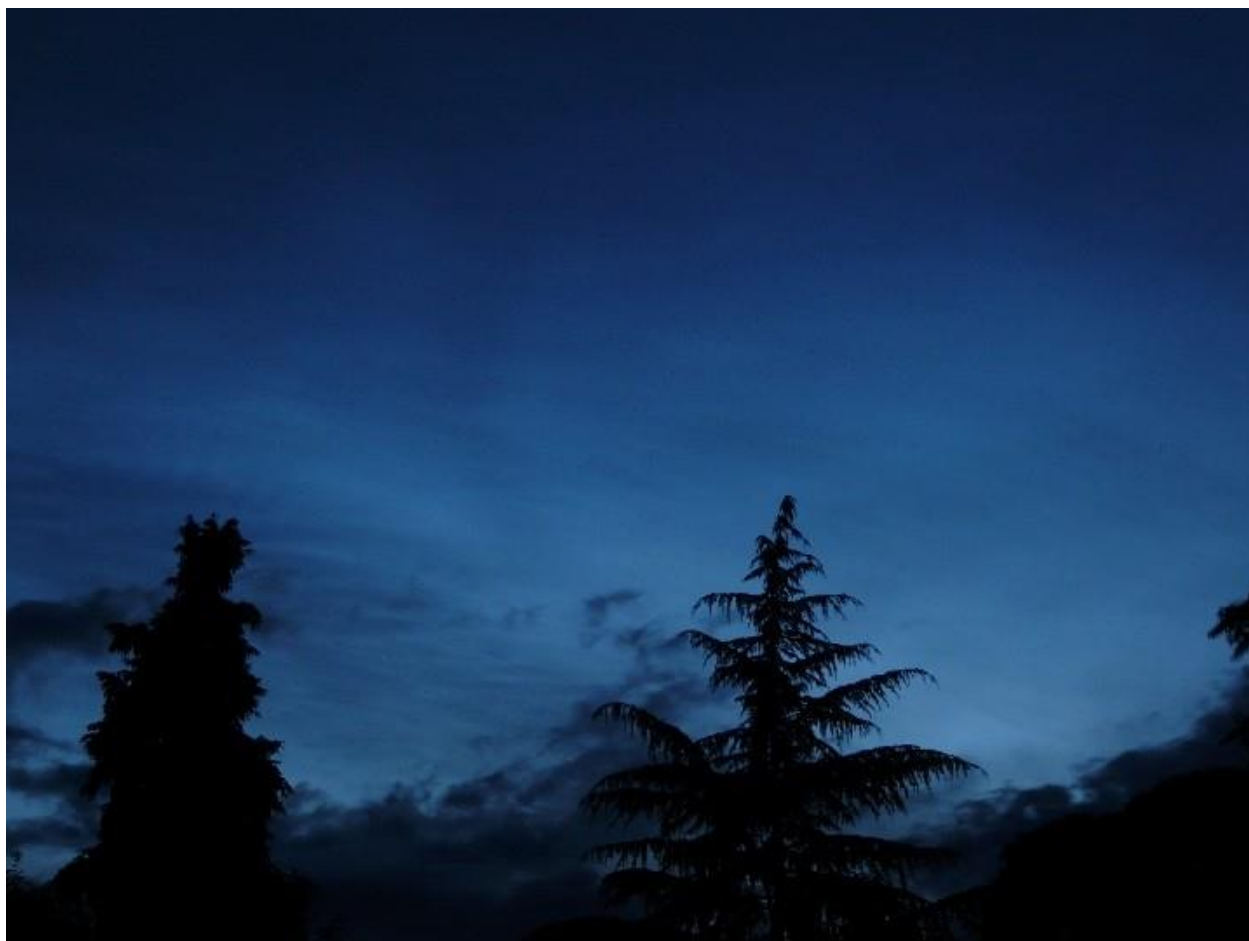
Abb. 6: Das gleiche NLC-Display wie in Abb.5, aber 15 Minuten später. 14.07.2009, 22:52 MESZ; Belichtungszeit 1.6s bei ISO 100; Brennweite 13mm digital, Blende 3.2. Sonne 9 Grad unter dem Horizont.